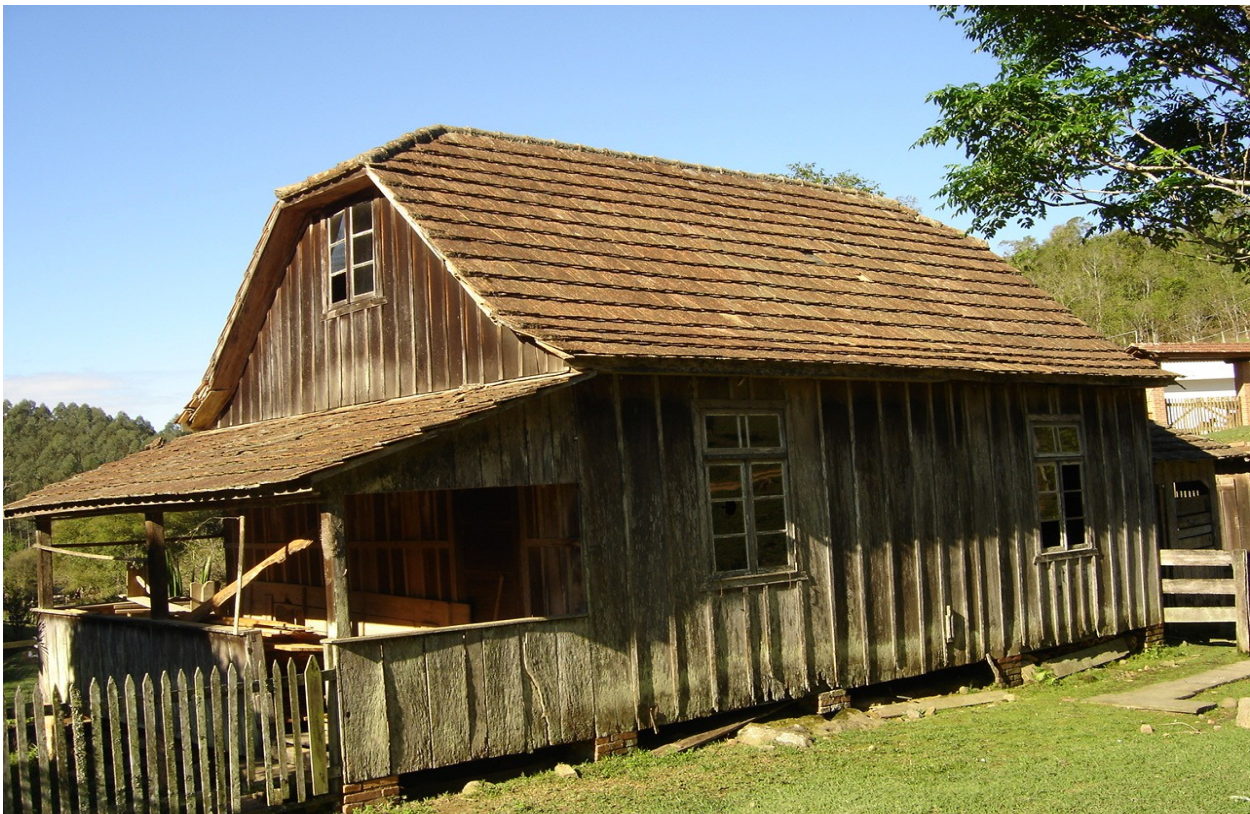
FOTO DA FACHADA LATERAL