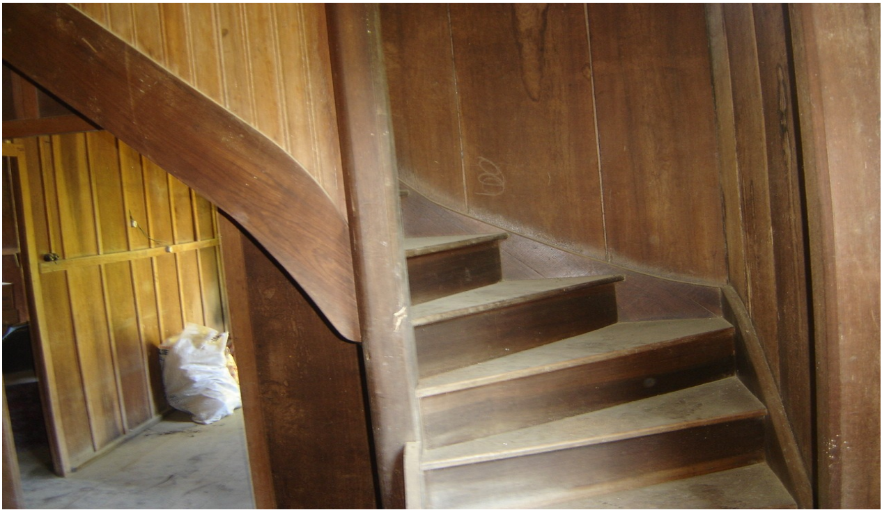
DETALHE DA ESCADA DE ACESSO AO SÓTÃO