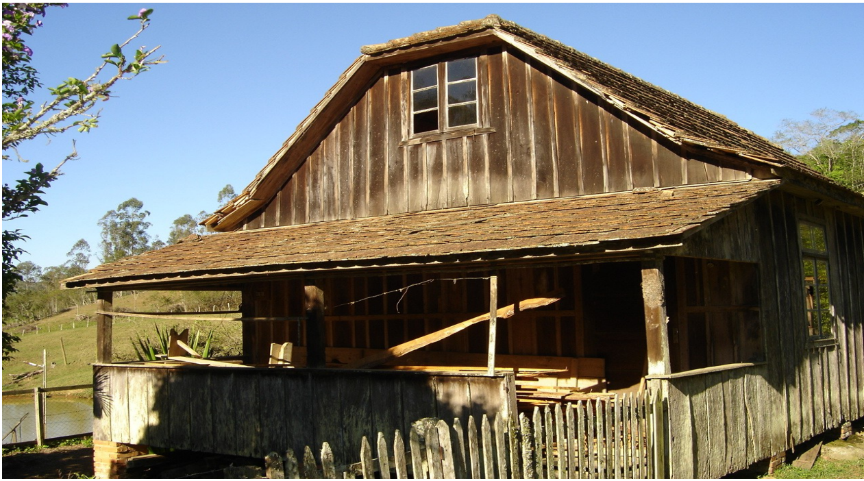
FOTO DA FACHADA FRONTAL